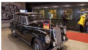
Haus der Geschichte