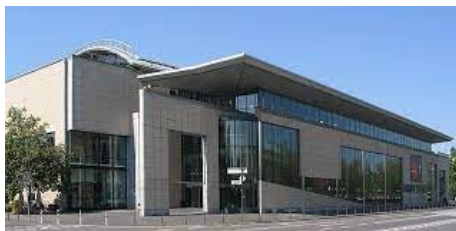
Haus der Geschichte